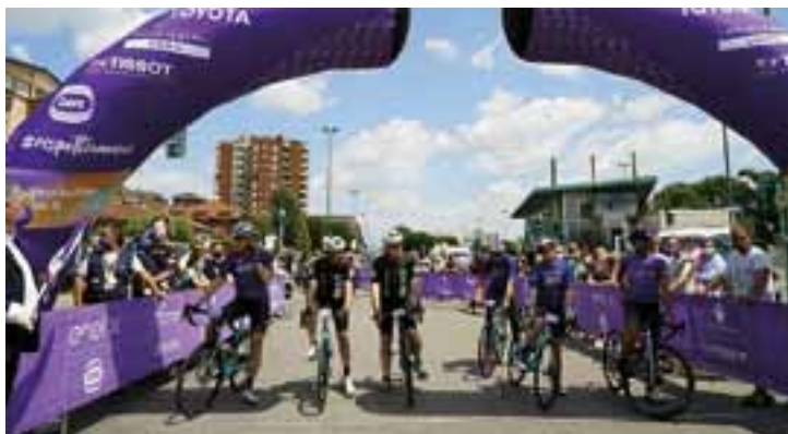
La partenza del Giro-e