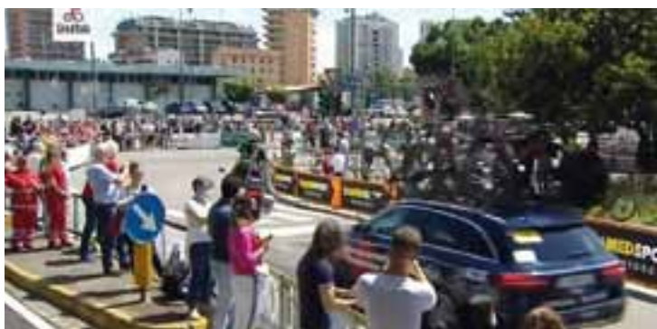
La cronometro del Giro d'Italia

La manifestazione è stata supportata da: CAP, Il Gigante, Città6, Decathlon, Coldiretti ed è stata allietata dalla Fanfara dei Bersaglieri.