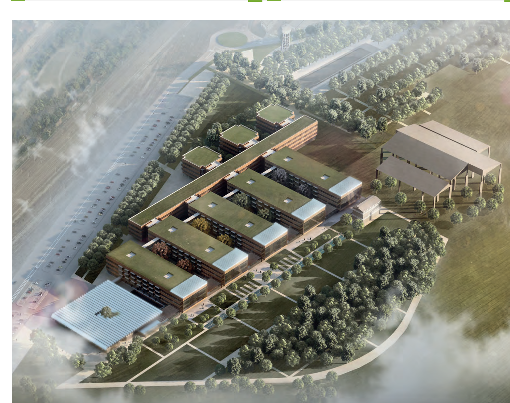
Progetto preliminare della Città della Salute e della Ricerca