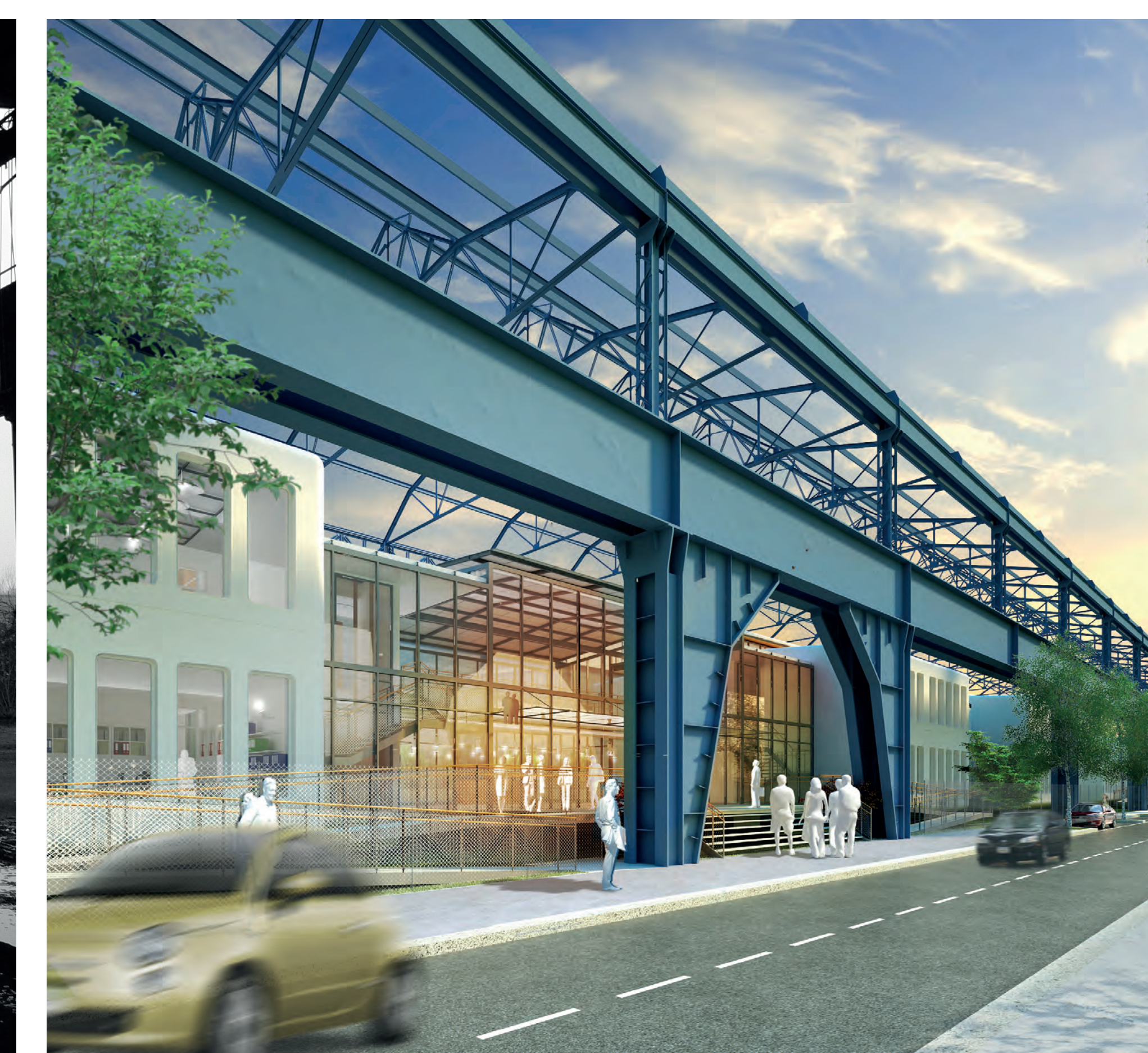
La rifunzionalizzazione del Treno Laminatoio