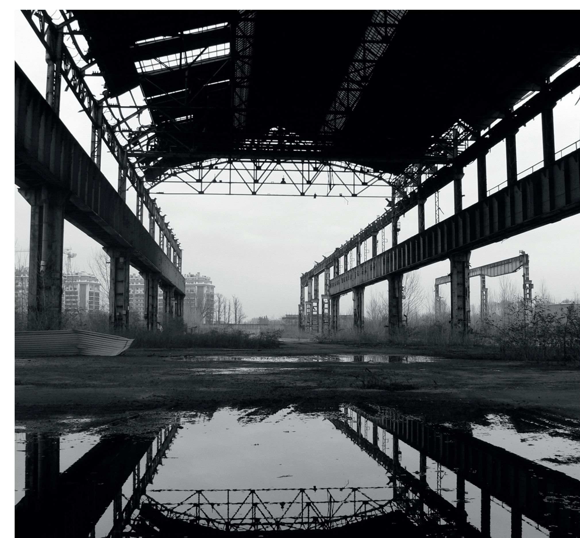
Fotografia storica del Treno Laminatoio