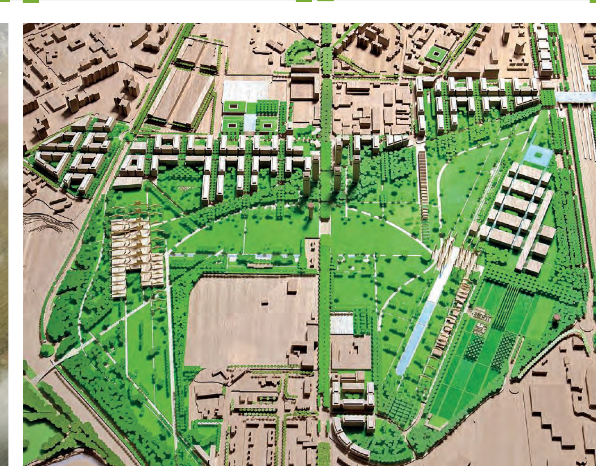
Modello della Variante al PII "Aree Ex Falck e Scalo Ferroviario"