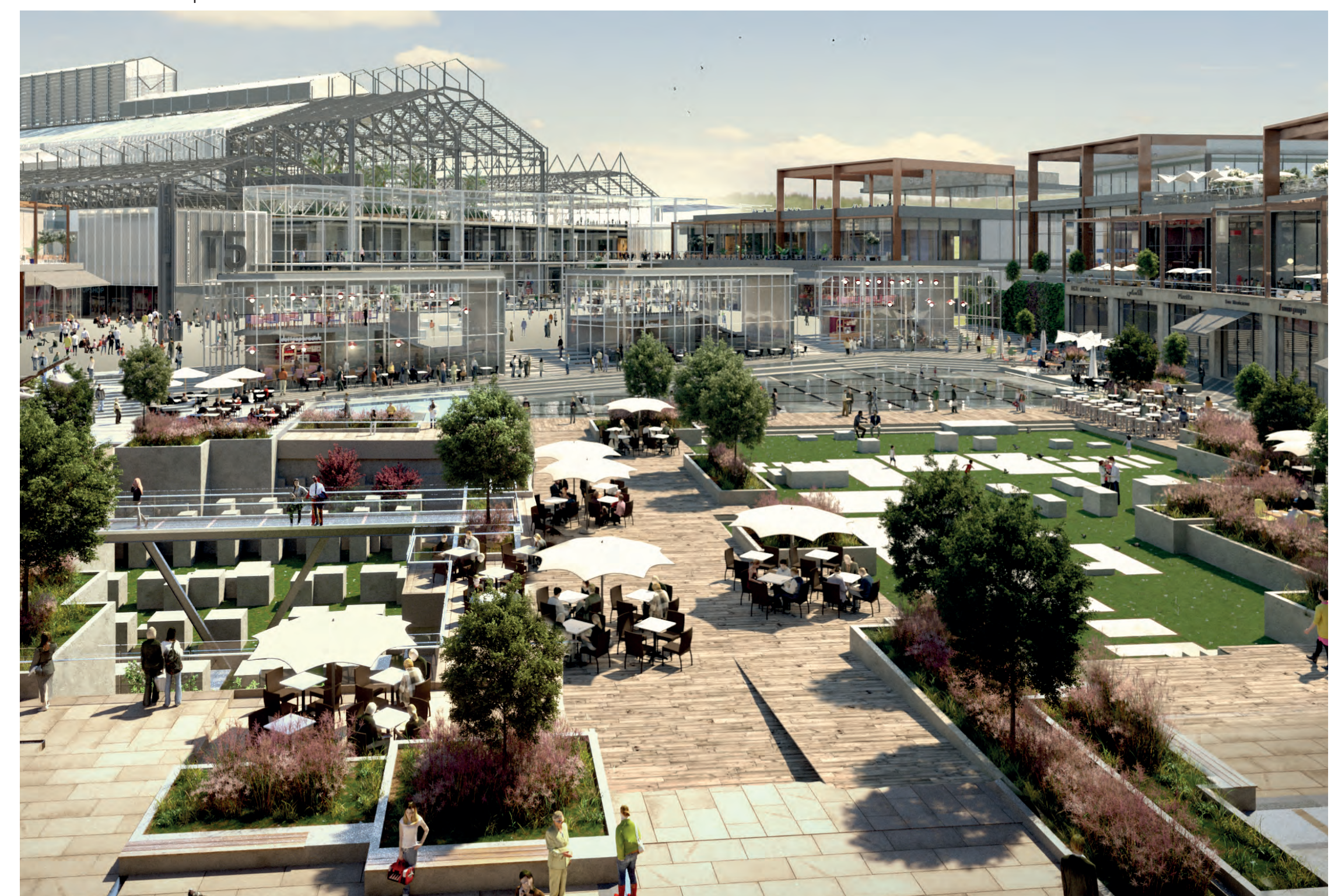
La rifunzionalizzazione dell'area Pompei