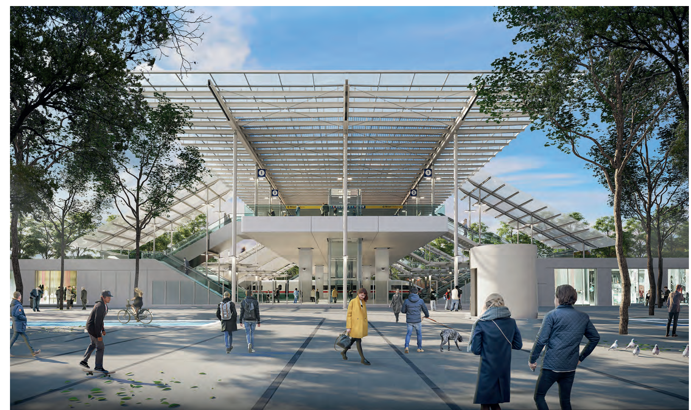
La stazione a ponte