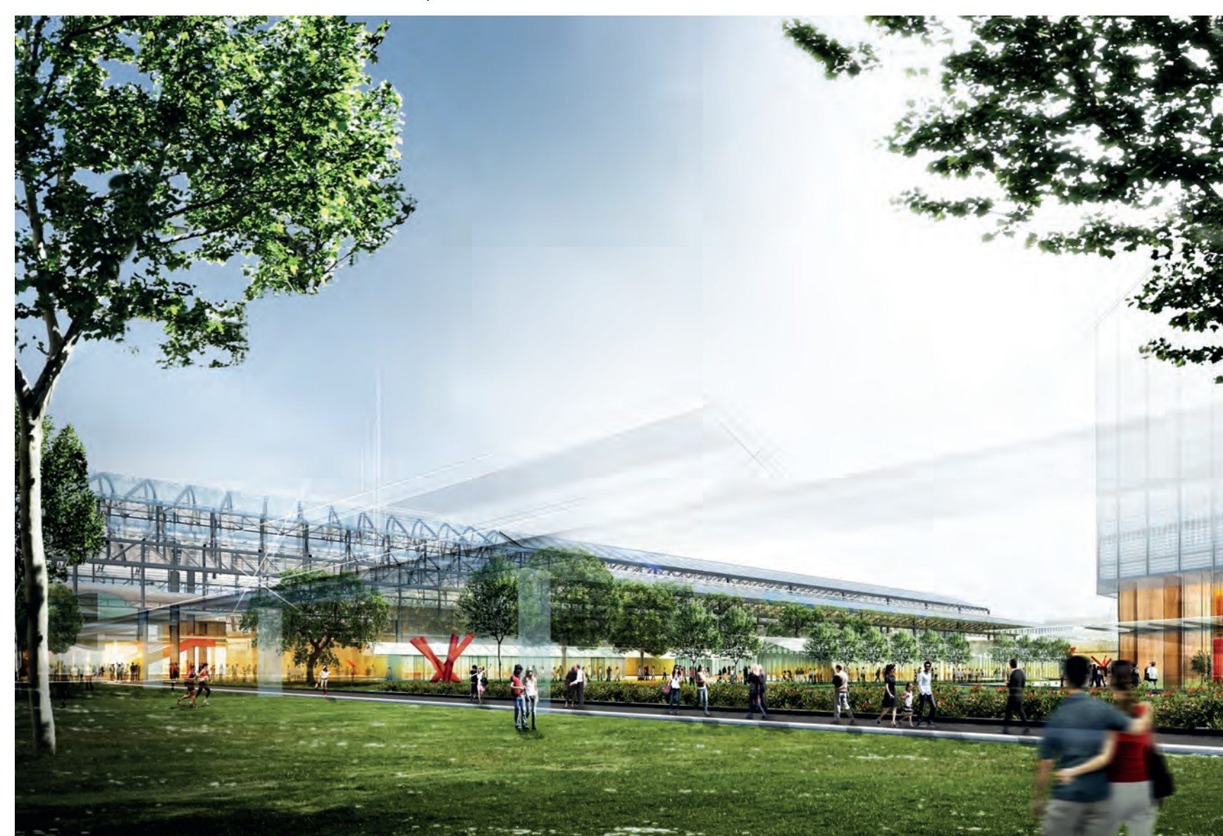
Il parco verso T5