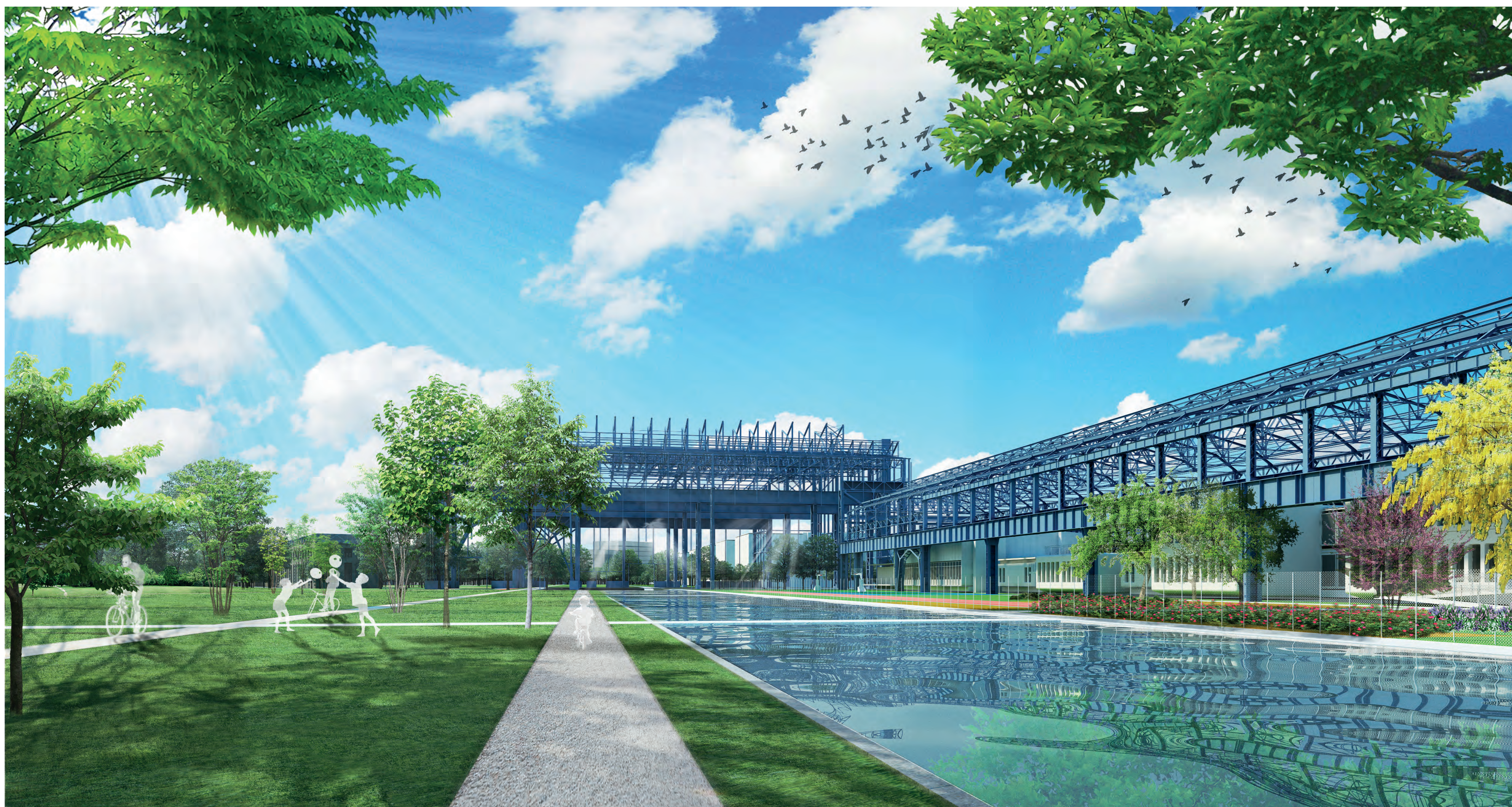
Il parco verso Pagoda T3 e Treno laminatoio