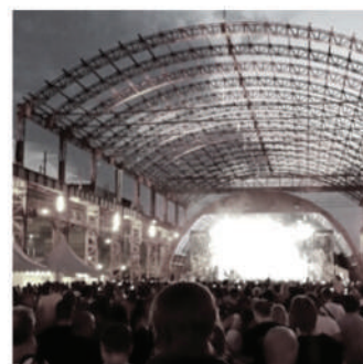
La ricerca "Analisi di competitività dell'area urbana di Sesto San Giovanni" è disponibile sul portale sestosg.net

volgendo le imprese del territorio, e dall'altra con la valorizzazione di spazi e immobili dismessi da riqualificare. Pensiamo soprattutto alle aree Falck, dove sorgerà la Città della Salute e della Ricerca, e all'area produttivo-terziaria di Sesto Marelli. È evidente quindi l'importanza di avere una chiara visione strate-