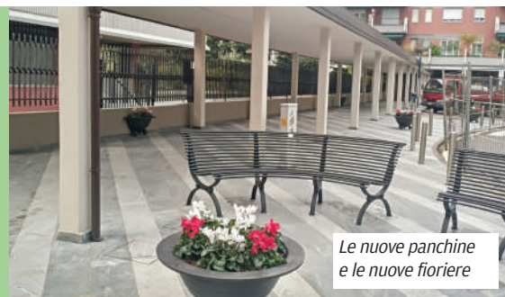
Le nuove panchine e le nuove fioriere

Dopo anni di trascuratezza, finalmente è stato inaugurato il nuovo porticato di via Marzabotto in seguito al restyling partito coi lavori di quest'estate. Oltre al rifacimento della pavimentazione e del solaio, è stato installato un nuovo impianto elettrico e sono state posate nuove panchine e nuove fioriere trasformando di fatto l'area in una piazza fruibile dai cittadini del quartiere. A breve verranno anche installate telecamere di videosorveglianza.