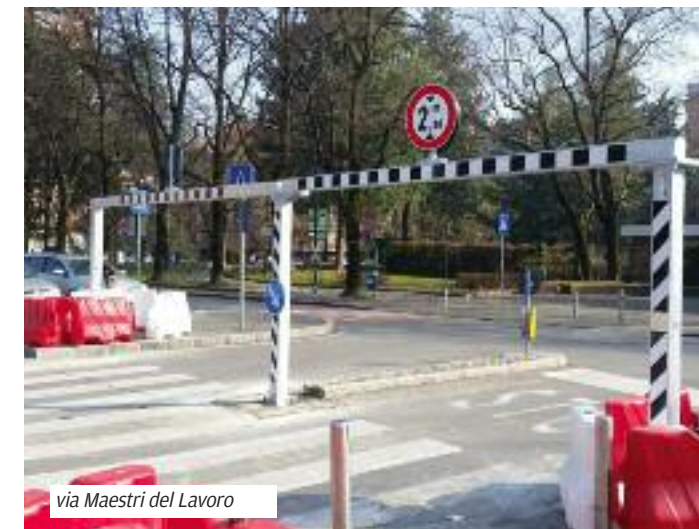
via Maestri del Lavoro