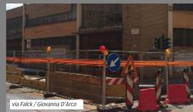
via Falck / Giovanna D'Arco

Via Falck / Giovanna D'Arco - Si tratta di un intervento a più lotti. I lavori si chiuderanno l'anno prossimo. Il cantiere di via Falck è stato sgomberato prima dell'inizio della scuola.