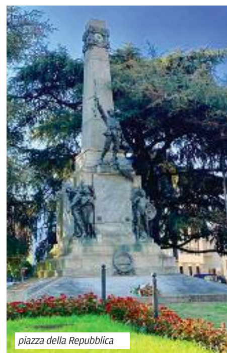
piazza della Repubblica