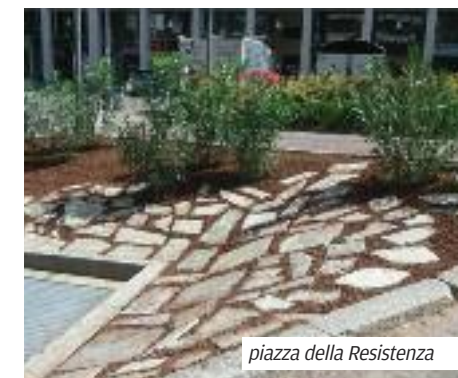
piazza della Resistenza